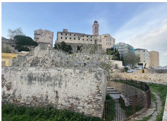
Un castillo en Bastia, Córcega