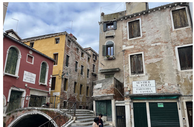
la famosísima Venecia