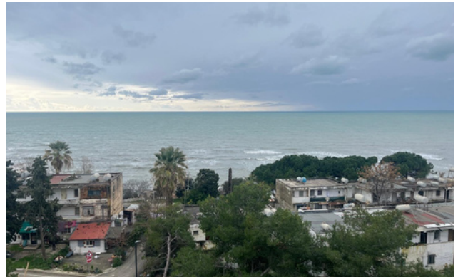
Una foto de la costa albanesa