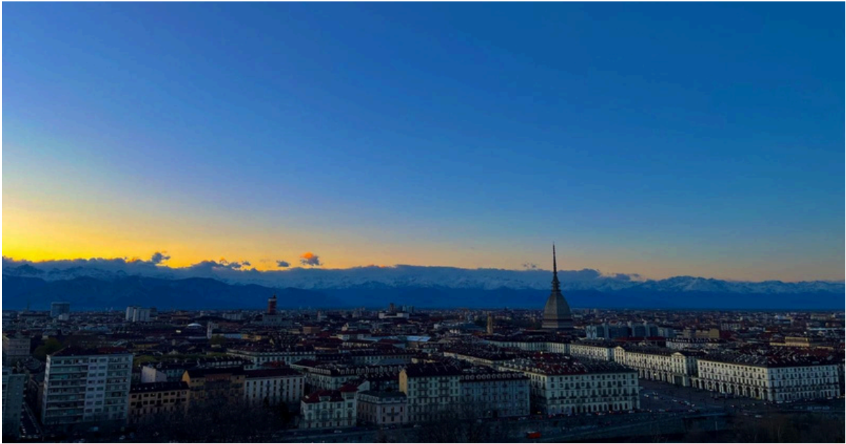
vista desde la iglesia de santa margarita en torino

Además, los puertos italianos ofrecen la posibilidad de viajar hasta la Costa Azul francesa, la costa dálmata, Córcega o Cerdeña, destinos que fuera de temporada se pueden disfrutar con tranquilidad y a precios más accesibles.