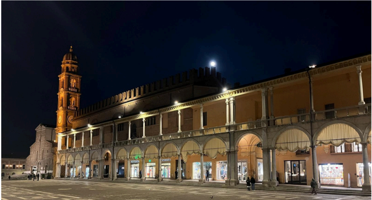
Faenza de noche