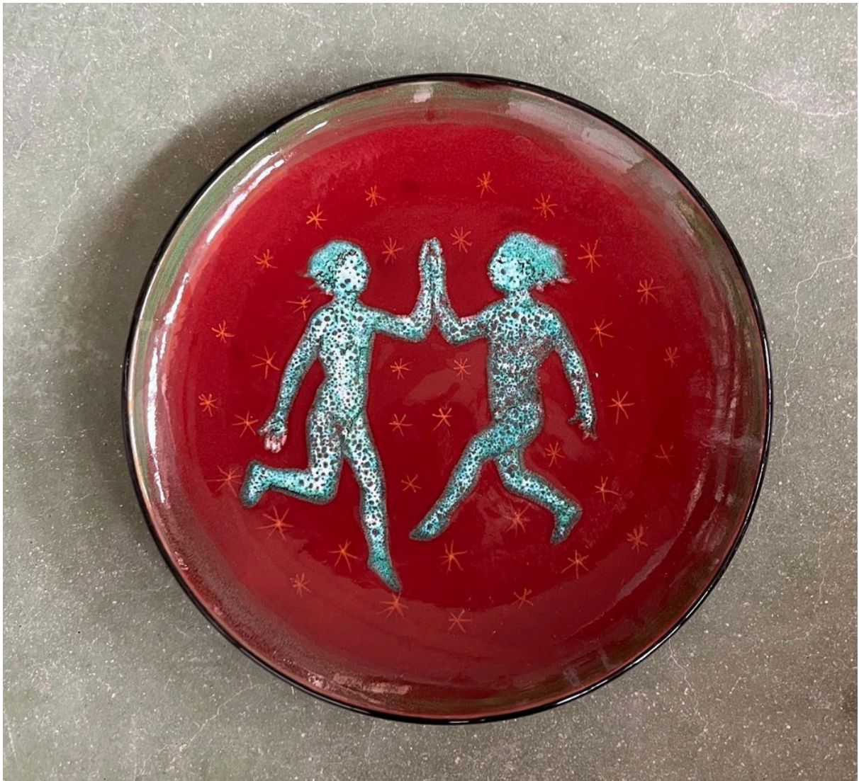
Plato con más de 100 años de la colección de Andrea