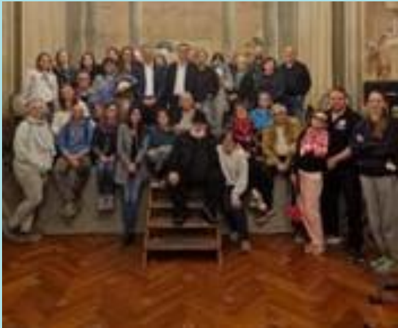
Assemblea dei soci @centceramicafaenza

En Faenza hay aproximadamente una cuarentena de ceramistas, no todos tienen bottegas, algunos se dedican a la enseñanza u otras actividades profesionales.